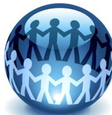
Ежегодный форум социального предпринимательства