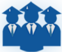
ШКОЛА СОЦИАЛЬНОГО ПРЕДПРИНИМАТЕЛЬСТВА