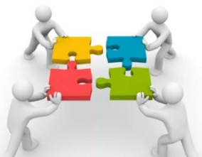
«SOFT SKILLS для социальных предпринимателей»